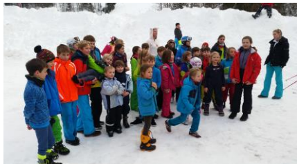
Bilder von früheren Ausfahrten